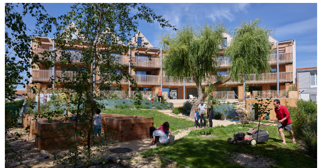
Vibrato - Atlerlab / Eden Promotion