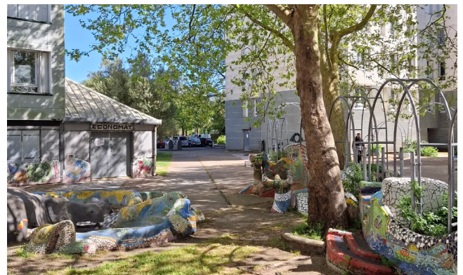
Les 400