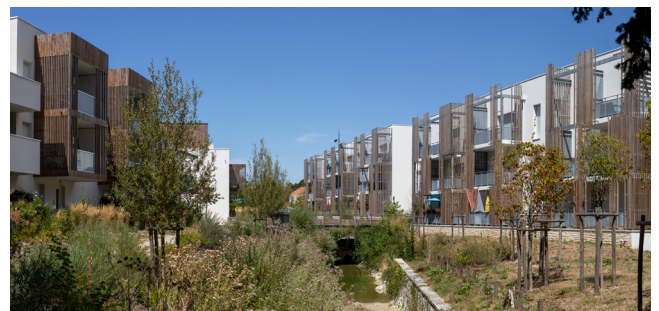
Coudray et Beaupréau - GDV architectes, COHEA / Bouygues immobilier, OPH CDA La Rochelle