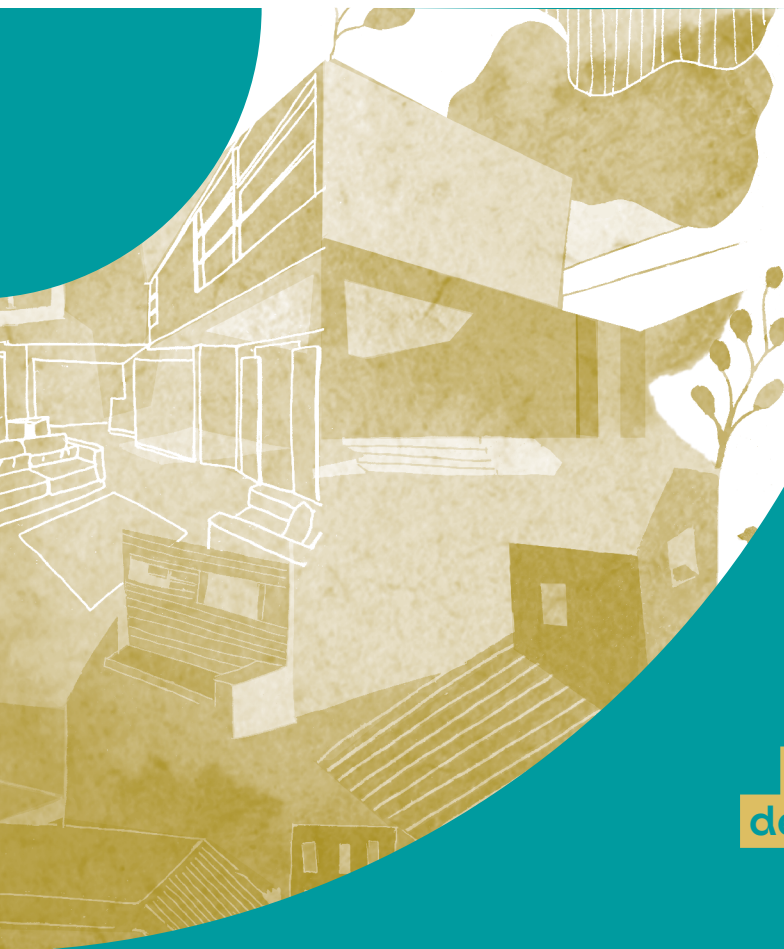
Table ronde et visite

Rénover autrement, une approche biosourcée du bâti existant